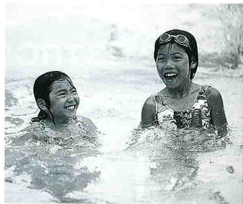
地域のふれあいに3千人 第二児童館夏まつり

子どもたちの夏休みはやはりプールが大人気！ 市内の市営プールは鶴ノ木、 新狭山公園、南入曽公園、 そして狭山台体育館・プールがあります。 表紙のひまわりのような笑顔は、 狭山台プールでの女の子二人組です。