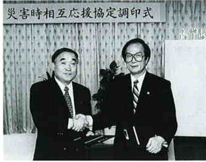
災害時相互応援協定調印式

暮らしの情報ページは主に公共機関などからのお知らせを掲載します。読み方は左上から右下に流れています。問い合わせや申し込みなどは➡の記号で表示します。市役所の代表電話番号は☎0429-53-1111です。