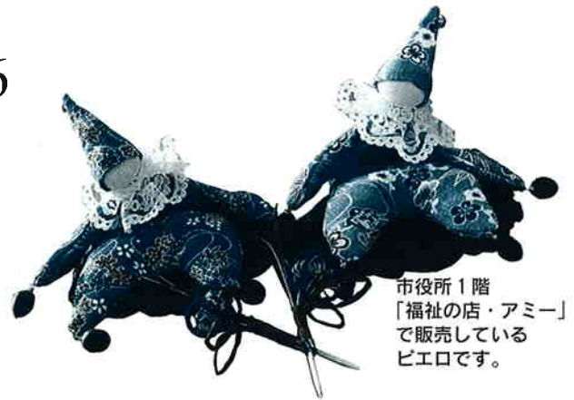
市役所1階 「福祉の店・アミー」 で販売している ピエロです。

広聴特集 皆様の声は 「市民とともに歩む市政」の実現に 大切な役割を果たしています .....2~5