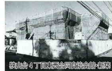
狭山台4丁目東西合同自治会館・新築