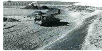
南入曽地区に入曽多目的広場(調節地)を整備中