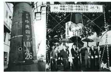
11月2日から住居表示の実施で入間川の一部地域の町名が中央1丁目～4丁目に変更