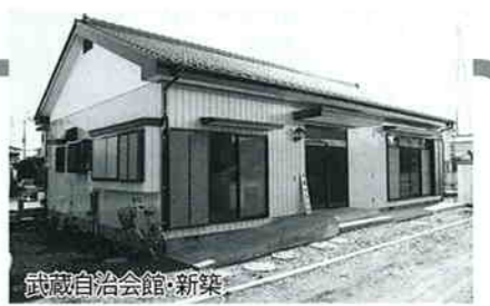
武蔵自治会館・新築