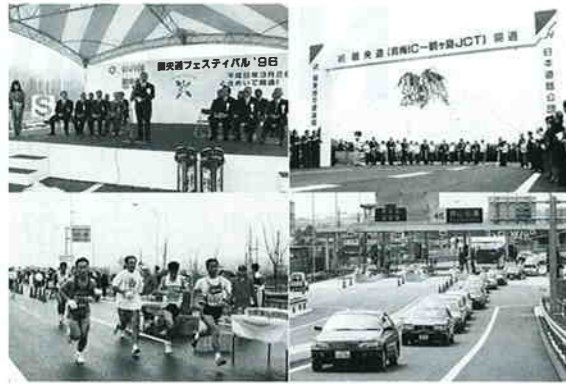
3月17日に圏央道の開通を記念して彩の国圏央道フェスティバルが開催し、3月26日に開通