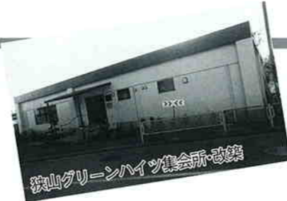
狭山グリーンハイツ集会所・改築

平成8年(1月～12月)に誕生した自治会館は「武蔵自治会館・新築」、「新狭山二丁目自治会館・新築」、「狭山グリーンハイツ集会所・改築」、「狭山台4丁目東西合同自治会館・新築」の4か所です。現在、工事が進められている施設は「根山自治会館」、「松風自治会集会所」、「水富10区自治会集会所」です。いずれの施設も狭山市コミュニティ施設特別整備事業の補助金を利用し、建設されています。 ※施設名称は決定していない施設もあります