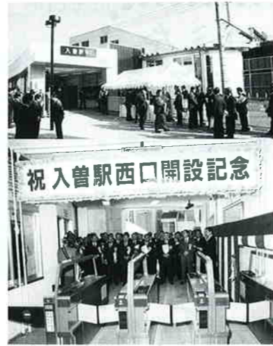
入曽駅西口の改札口が2月29日から利用開始