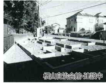
根山自治会館・建設中

平成8年(1月～12月)に誕生した自治会館は「武蔵自治会館・新築」、「新狭山二丁目自治会館・新築」、「狭山グリーンハイツ集会所・改築」、「狭山台4丁目東西合同自治会館・新築」の4か所です。現在、工事が進められている施設は「根山自治会館」、「松風自治会集会所」、「水富10区自治会集会所」です。いずれの施設も狭山市コミュニティ施設特別整備事業の補助金を利用し、建設されています。 ※施設名称は決定していない施設もあります