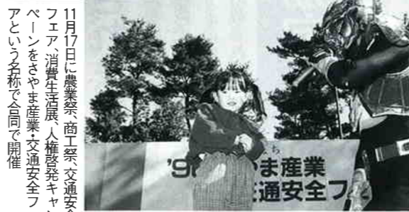
11月17日に農業祭、商工交交通安全フェア、消費生活展、人権啓発キャンペーンをさやま産業交通安全フェアという名称で合同で開催