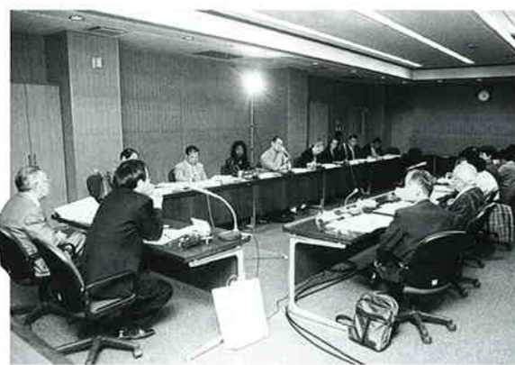
5月25日に「いじめ根絶対応委員会」を設置