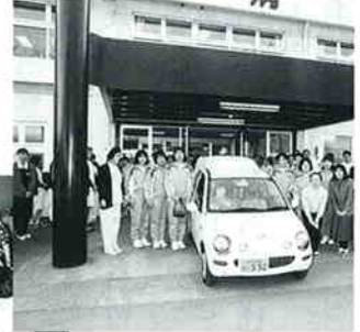
狭山台南小学校の余裕教室を利用し、6月28日から工房夢来夢来が開所