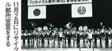
11月2日にリサイクル都市宣言をする