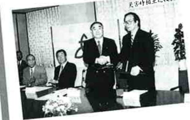
7月24日に大規模災害に備え、神奈川県厚木市と災害時相互応援協定を締結