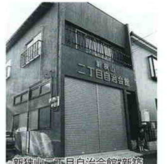
新狭山二丁目自治会館・新築