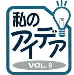
支持部 毛抜き部 バネ部

対して有効な角度に曲げること、毛抜きの方向が自由に選択でき、作業が簡単に行えます。さらに、皮膚のひっつきなどの危険性も大きく改善されているものです。そして、指にフィットするデザインは安全で疲れにくいものになっています。 製作 鈴木孝さん(アイデアクラブ)