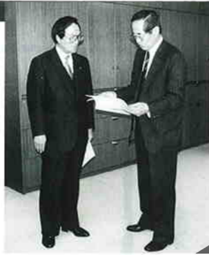
建設省・幹事務次官に要望書を提出

暮らしの情報ページは主に公共機関などからのお知らせを掲載します。読み方は左上から右下に流れています。問い合わせや申し込みなどは➡の記号で表示します。市役所の代表電話番号は☎0429-53-1111です。