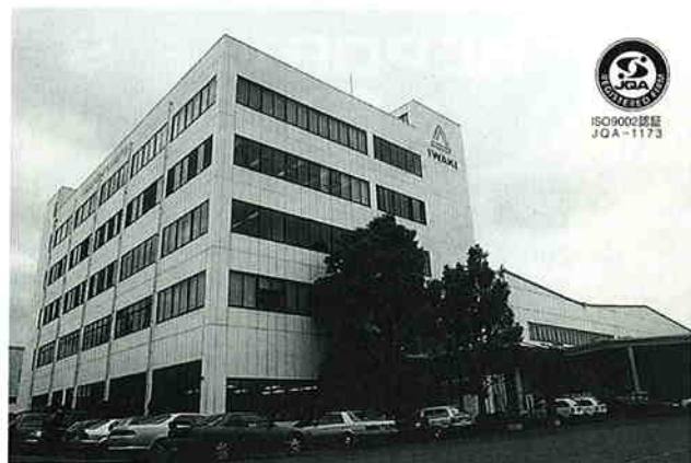
株式会社イワキ(上広瀬59-1-9)

株式会社イワキは昭和31年に設立され、昭和49年、上広瀬で埼玉工場の稼働を開始しました。同社は、産業用特殊ポンプの総合メーカーとして製品を販売するだけでなく、顧客の要求するものを的確に製品化していくという『多品種思考』で時代のニーズにこたえてきました。特に、薬品を扱う化学プラント用ケミカルポンプ分野では、金属ではなく薬品に強いプラスチック材料を使用し、その活用技術で世界トップの品質のよさとシェアを誇っています。これも開発に対する意気込みと顧客の要求に細部まで応えた結果であり、これが同分野で圧倒的支持と信頼を得ているイワキの製品づくりなのです。