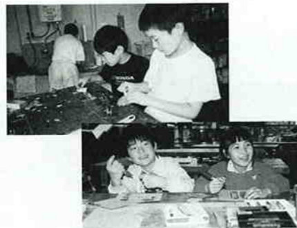
問い合わせ：中央児童館へ ☎53-0208

このクラブではのこぎりや金づちなどを使っていろいろなものを作っています。そして、その中でひと工夫して、自分のオリジナルのアイデアを生かします。今までに、回り灯籠やポンポン船などを作りました。そして今度は、万華鏡を作る予定です。学校ではあまりほかの学年の子と遊ぶことはないけれど、クラブに来るとほかの学校や学年の子とも遊べるから