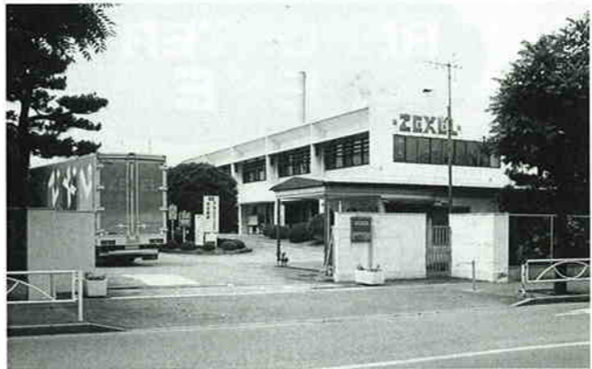
株式会社ゼクセル狭山工場 新狭山1-5-14 ☎53-5217

昭和14年に設立、ディーゼルエンジン用燃料噴射ポンプとノズル、カーエアコン、建設機械用の油圧機器、ガソリンエンジン用噴射ノズルを製造し、ハウジングエアコンなどの新分野にも進出しています。昭和40年に建設された狭山工場では、燃料噴射ポンプの重要保安部品であるノズルホルダーを生産し、国内外の自動車メーカーに供給しています。