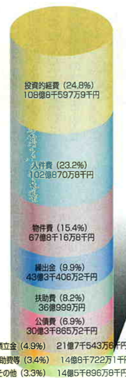
図3 歳出の性質別内訳 (100%)

す。主に建設事業に活用されており、余熱利用施設(仮称)建設事業費や消防本部庁舎建替事業などの普通建設事業費となっています。次に職員の人件費などの物件費、物品購入や事業委託などの物件費となっています。図4は市税と目的別歳出を市民の皆さん一人当たりで換算したものです。市税は14万9千612円で前年度比0.4%の増、歳出は、27万1666円で、前年度比1.0%の増です。歳入歳出の差は、平成9年度へ繰り越しました。