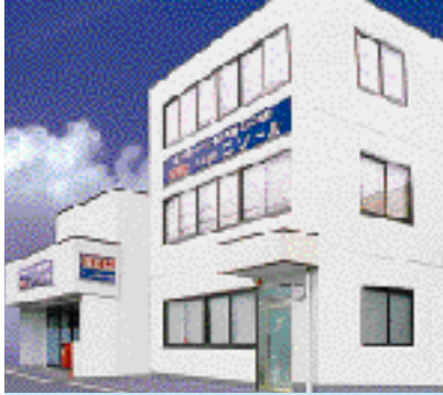
株式会社ニソール (富士見2-2-12)

株式会社ニソールは、昭和51年に狭山市で創業され、全ての電子機器の基礎であるプリント配線基板の設計・製作を行い、エレクトロニクスメーカーを縁の下で支える企業として今日に至っています。