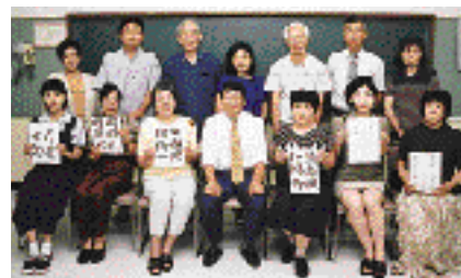
これから書道をはじめようかなと思っているかた、ぜひ一度あそびに来てみてはいかがでしょうか。楽しいですよ。

この会は、奥富小学校で開催された学校開放講座「書道に親しもう」を受講したことがきっかけで、平成8年に発足しました。私たちのモットーは、自分自身が書道をどれだけ楽しむことができるかです。自分の作品を他人の作品と比較して優劣をつけることが目的ではありません。気楽に伸びのびと学んでいます。先生も、その人のレベルに合わせた的確な指導をしてくれるので、初心者でも安心して楽しむことができます。