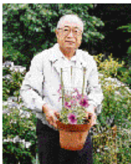
苗をお分けします。あなたも花を育ててみませんか。

20年ほど前、庭付きの住宅を購入したことがきっかけで園芸を始めました。6年前に病気で体調を崩した時も、外で好きな草花と過ごしたことが健康回復にたいへん効果があったようです。それ以来、園芸が私の生きがいになり、今では隣の空き地20坪を借りて、100種類もの草花やサツキなどの苗を栽培し、年間1千鉢を目標に、自治会のリサイクル