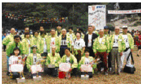
◀ 昨年の訪問団の皆さん