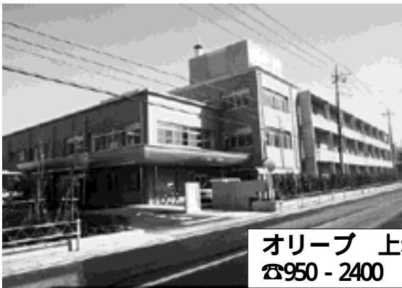
オリーブ 上赤坂290-1 ☎950-2400

市では、21世紀の高齢社会に対応するため、狭山市老人保健福祉計画に基づいて、施設整備などのハード面と、在宅介護支援などのソフト面の両面から、高齢者に対する各種保健福祉サービスを計画的に推進しています。この計画は今年度が最終年度となり、4月から始まる介護保険制度に向けて、新たな狭山市新老人保健福祉計画・介護保険計画を策定したところです。こうした中で、このたび堀兼地区に社会福祉法人の設立による特別養護老人ホーム「オリーブ」が開所しましたので、概要をお知らせします。