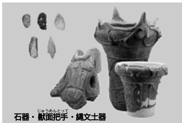
石器・獣面把手・縄文土器

開催日3月18日(土)～6月18日(日) 内容大地に刻まれた歴史として時を超え、再び姿を現した埋蔵文化財。これら一点一点が物語る歴史を「編年・遺構・遺物」という側面から分類、解説し、21世紀に向かっての埋蔵文化財に対する取り組みも踏まえて紹介します。解説日3月25日、4月22日、5月27日の土曜日、いずれも10時から 申し込み不要