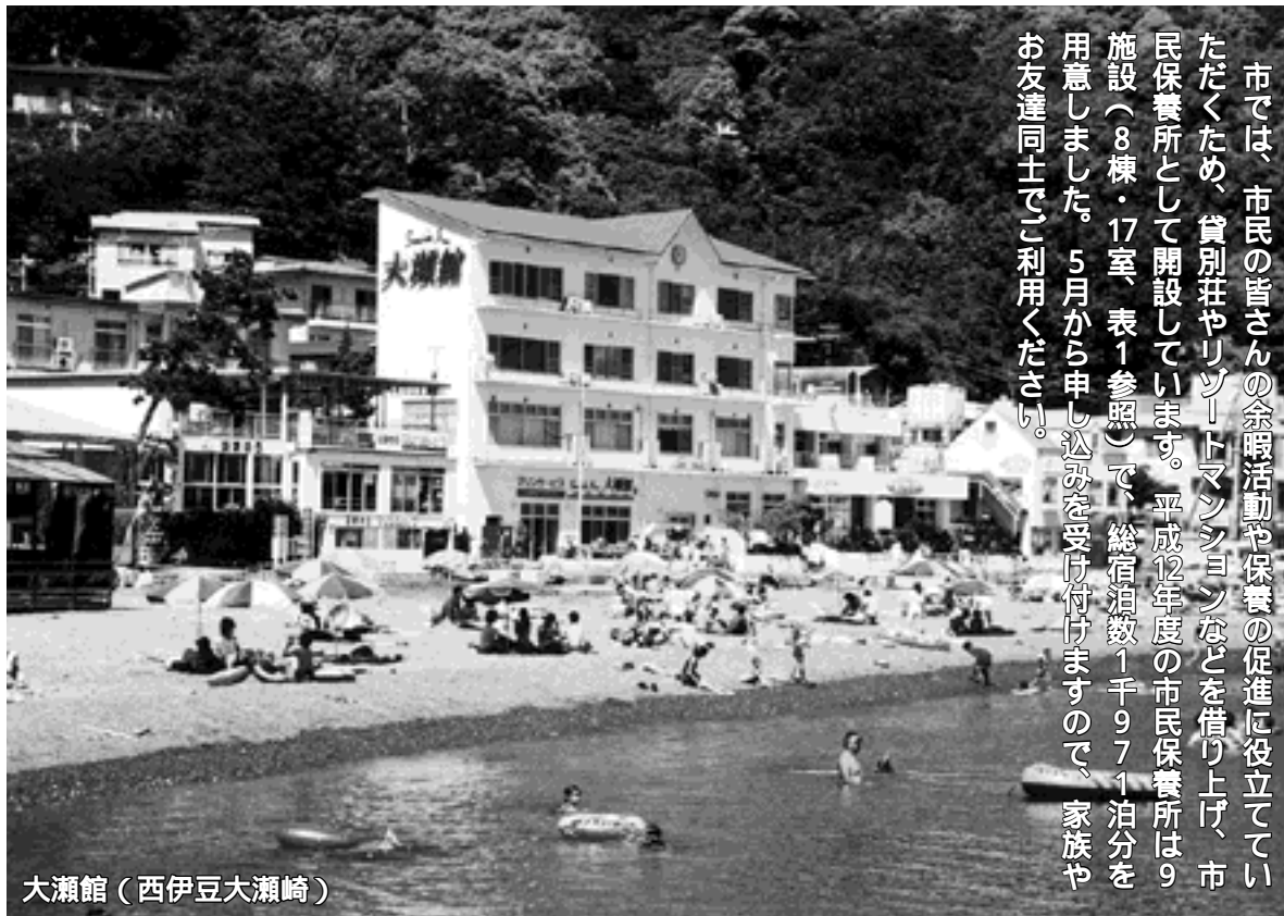
大瀬館(西伊豆大瀬崎)

市では、市民の皆さんの余暇活動や保養の促進に役立てていただくため、貸別荘やリゾートマンションなどを借り上げ、市民保養所として開設しています。平成12年度の市民保養所は9施設(8棟・17室、表1参照)で、総宿泊数1千971泊分を用意しました。5月から申し込みを受け付けますので、家族やお友達同士でご利用ください。