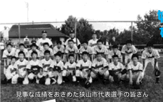
見事な成績をおさめた狭山市代表選手の皆さん

ワージントン市との交流事業第1弾として、市内の中学校から選抜された21名の選手が同市を訪問し、野球を通して国際交流を深めました。