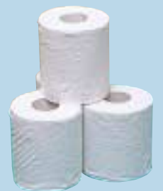
回収された古紙はトイレットペーパーに

事業所古紙共同回収システムは、会員事業所を効率よく巡回して回収をしていくため、特に紙類の排出量が少ない事業所も参加しやすいシステムです。 事業所リサイクル推進協議会では、「会員事業所からの古紙回収」と「再生品の積極的な利用を通して、ごみの減量と省資源を図り、企業として環境や社会へ貢献していくこと」を目的に活動しています。 今後は、この両輪をさらに充実していくために、回収した古紙を原料にトイレットペーパーを作り、会員事業所で積極的に利用していくことを予定しています。