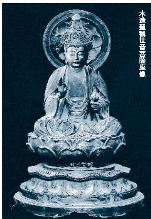
木造聖観世音菩薩座像

この仏像は、慈眼寺が阿彌陀堂と称していた時代の本尊と考えられ、一木造りと呼ばれる平安時代の技法で造られた、市内最古の仏像です。