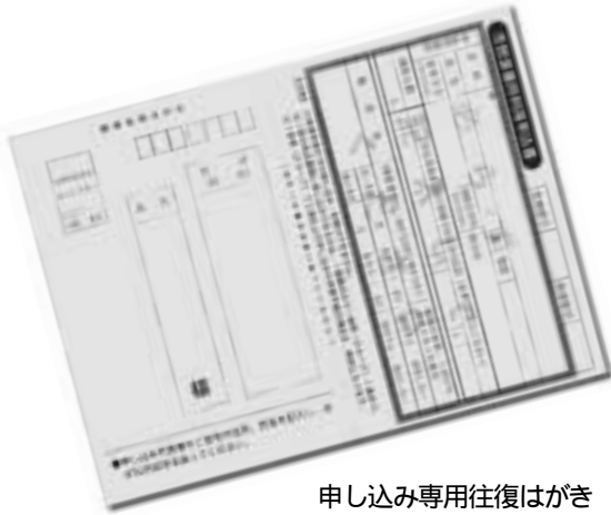
申し込み専用往復はがき

の往復はがき(市民活動支援課出張所・公民館・図書館に用意)に必要事項を記入し、申し込み期間内に郵送(締め切り日の消印有効)するか、直接市民活動支援課までお持ちください。