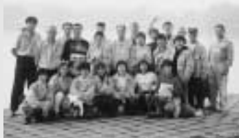
昨年の訪問団の皆さん。杭州市と友好を深めながら中国内を視察しました(杭州・西湖畔)

友好都市の中国・杭州市で「2002年西湖国際マラソン大会」が開催されるのにあわせ、今年も参加ランナーと杭州市親善訪問団員を募集します。中国四千年の歴史と文化にふれながら、さまざまな市民交流ができる絶好のチャンスです。また、上海、周荘、無錫、蘇州など江南の諸都市を訪問する盛りだくさんの内容です。さあ、あなたも両国市民を結ぶ「親善大使」として一緒に杭州へ行きませんか!