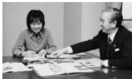
ゴルフ競技は東京ゴルフ倶楽部(柏原)で、そしてボウリング競技は新狭山グランドボウル(新狭山)を会場にして、熱戦が繰り広げられます。

国体のマスコット「コバトン」に競技会場として整備された智光山公園のテニスコートを用意してもらいました。今回の整備で、夜間照明付きのコート6面を含む砂入り人工芝コート16面にリニューアルされ、クラブハウスや189台収容できる駐車場も完備し、県内多数の施設となったテニスコートは、早くも参加する選手や応援する人々たちを待ちわびているようです。「国体に参加する全国の選手や監督の皆さんに、狭山市に来てよかったと言われようかな、真心のこもった大会にするためには、市民皆さんの力が必要です。」と事務局の方が話していました。選手や応援する人。そして、その人々たちを温かく迎える人。それぞれの気持ちの一つになることが、大会成功の鍵であると思います。