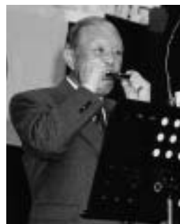
ハーモニカで「夕焼けこやけ」「春が来た」を披露する土屋知事

2月6日、土屋義彦知事がさわやかふるさと訪問で入間川小学校を訪れました。この事業は知事が自ら県内の先進的、意欲的な取り組みを行っている団体などを直接訪問し、その活動状況の視察と県民の声を直接聴くものです。 出迎えを受けた知事は、外国語キャラバン隊と学校ボランティアが協力して進める2年生の国際教育理解の授業と4年生の環境教育を視察しました。特に環境教育で