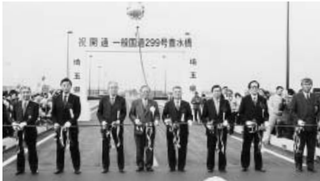
開通式典のフィナーレを飾るテープカットが、水富小学校の鼓笛隊によるファンファーレを合図に華々しく行われました。

豊水橋の開通式典が2月8日(土)に行われ、午後4時から通行できるようになりました。