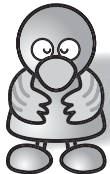
彩の国まごころ国体マスコット:コバトン