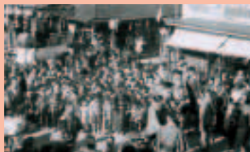
市制施行記念を祝う旧入間川町の 人々