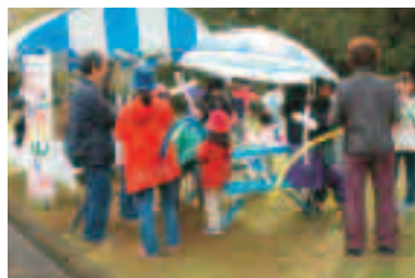
風船でいろいろなものを作ったよ