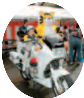
白バイに乗ってハイポーズ

10月31日(日)狭山稲荷山公園で市民フェスティバルが行われ、約30,000名が来場しました。2004レクリエーション広場、交通安全フェア、商工祭、熱気球の搭乗体験、さやまっ子ラリーなどのコーナーが設けられ、メインステージでは終日ダンスや民踊、よさこいなどが披露されました。参加した市民の元気と市の商工業の活力が一体となった50周年の記念イベントにふさわしい素晴らしい素晴らしいフェスティバルになりました。