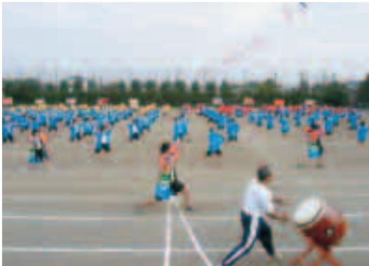
練習の成果を体育祭(9月25日)で披露