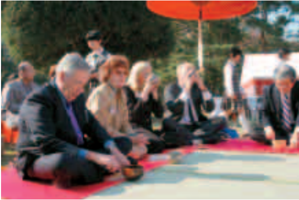
日本の伝統文化に触れる ワージントン市の皆さん

あなたが写っていませんか？広報さやまに掲載した写真は、広報課で撮影したものでしたら無料で差し上げます。広報課までご連絡ください。