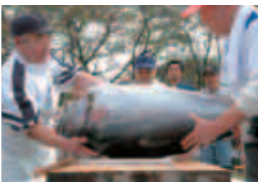
商工祭恒例のマグロの解体