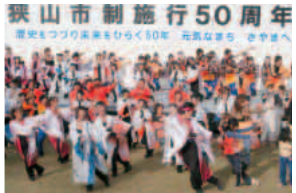
参加者がステージに集結！最後を飾ったよさこい