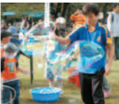
大きなシャボン玉ができました