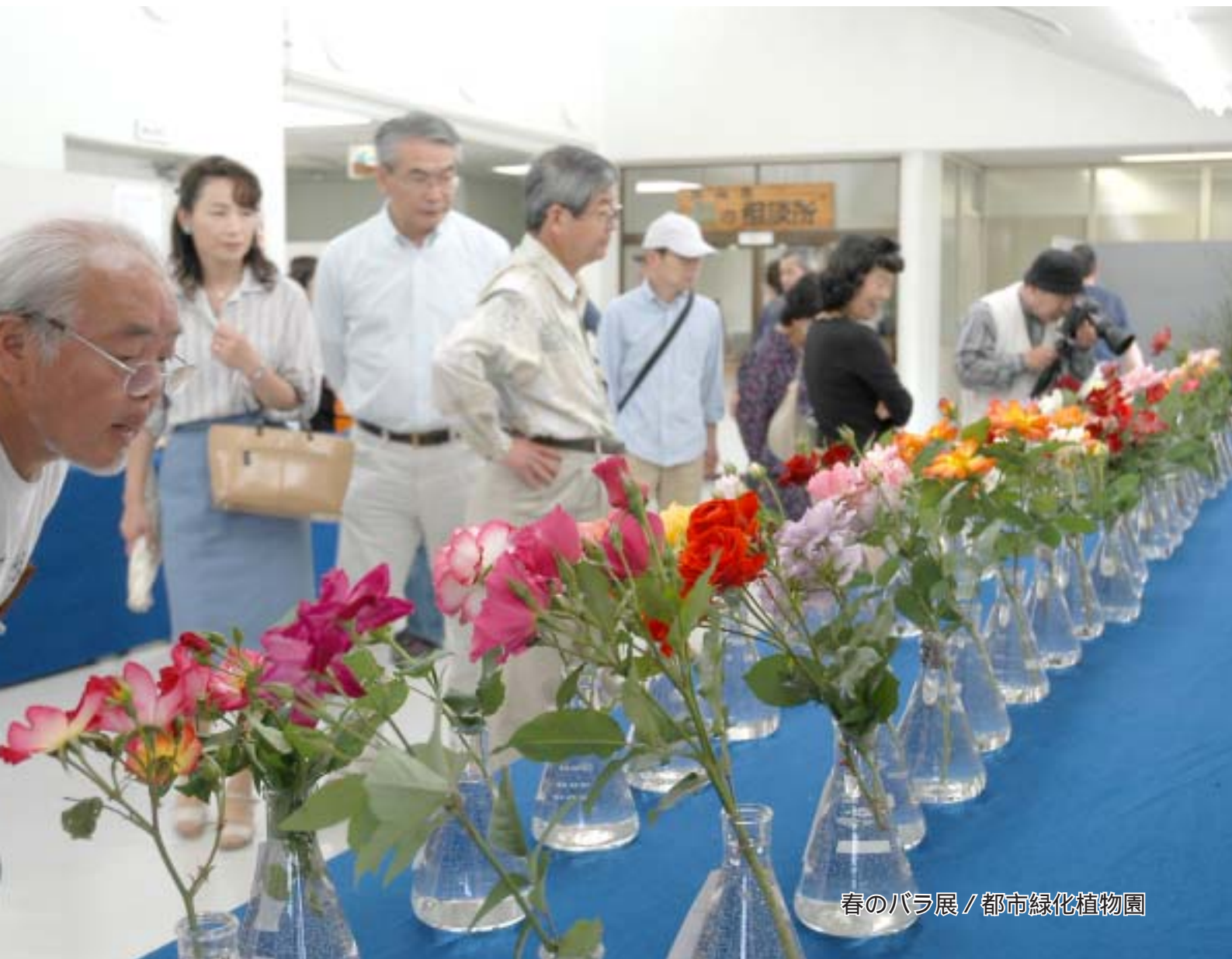
春のバラ展 / 都市緑化植物園