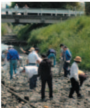
約2.6トンのごみを回収した 不老川クリーン作戦

● 私たちの地域は自分たちできれいに 不老川クリーン作戦・圏央道側道クリーン作戦！