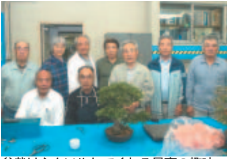
盆栽は心をいやしてくれる最高の趣味

奥富盆栽愛好会の歴史は古く、地域の盆栽好きが集まり活動を始めてから40年以上が経ちます。現在は、男性13名、女性4名の17名で、奥富公民館に月に1回集まり、盆栽の剪定や意見交換などを行っています。また、年2回の作品展をはじめ、公民館事業の園芸講座・正月の寄せ植えの手伝いなどを行っています。