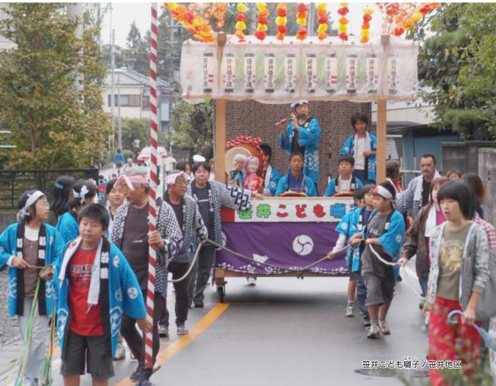
笹井こども囃子 / 笹井地区