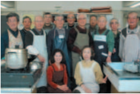
活動は今年で12年め。エプロン姿も板につきました

狭山台シルバークッキング会は、60歳以上の男性ばかり15名で活動するサークルです。毎月第2・4木曜日に狭山台公民館で、気軽に楽しめる家庭料理を作っています。