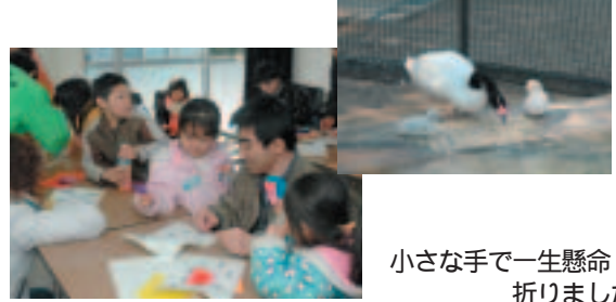
小さな手で一生懸命 折りました

2月18日～26日の土・日曜日、こども動物園で折り紙教室を開催しました。子どもたちは、犬、フラミンゴの動物とおひな様の折り紙に挑戦。お父さんやお母さんに手伝ってもらい、テキストを見ながら一折一折ていねいに仕上げていました。