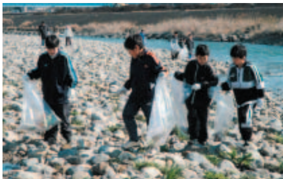
参加者のうち約400人は子ども達

3月4日、入間川クリーン作戦が、入間川河川敷の新豊水橋から狭山大橋までの6会場で一斉に行われました。当日は、晴天に恵まれ、1,123名の方が参加し、空き缶やペットボトル、プラスチックごみなど、約5.4トのごみを回収しました。