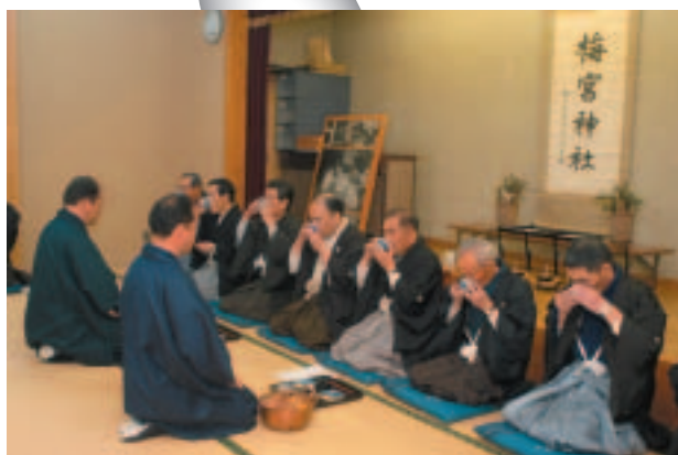
甘酒の仕込みは1月の中旬から、味は毎年違います