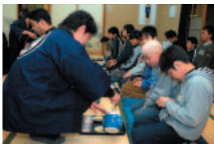
子ども達は、甘酒の代わりにお茶を飲みます

2月10・11日(金・土)、甘酒祭りが上奥富の梅宮神社で行われました。この祭りは、平安時代からの長い歴史のある謡をあげては盃をすすめる饗宴型の酒盛りで、9組の頭屋が順番で祭礼を行います。10日夜の座揃式では、地元の子ども達も参加し、慣れない正座をしながら、緊張した面持ちで式の進行を見つめていました。そのまなざしからは、「いつか自分たちも行事に参加するんだ」という思いが感じられました。また、頭屋を引き継ぐ頭渡しが行われた11日の大祭は、参道に露大が立ち並び、境内は大勢の人でにぎわいました。