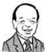
狭山市長 仲川幸成 似顔絵：池原昭治氏