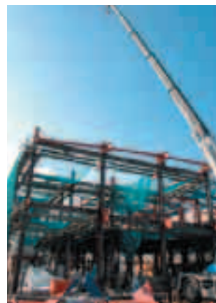
着々と工事が進むリサイクルプラザ