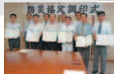
災害時、必要な資機材や人員を確保