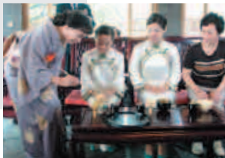
日本文化を中国の方へ