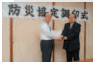
災害時、トイレ不足解消のために