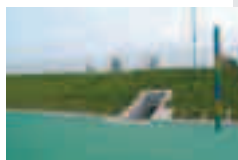
不老川の治水対策が充実