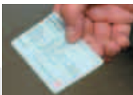
一人1枚のカード型

10月2日 堀兼・新狭山地区でプラスチック類の分別収集を開始。これにより市内44,900世帯が分別収集対象地区に平成20年の稼働を目指し、狭山市リサイクルプラザの建設を開始(8月)