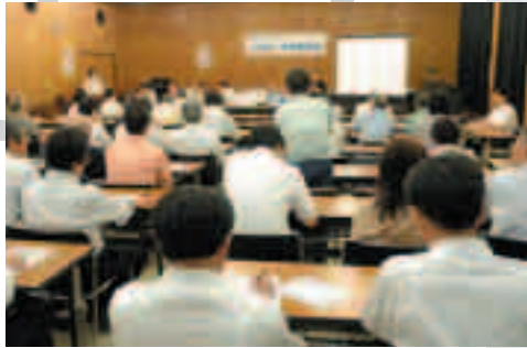
環境、福祉、教育など市長と直接対話

2006年...今年も残りわずかとなりました。この1年は、皆さんにとって、どんな年だったでしょうか。市では、狭山市駅西口地区の整備・市街地再開発事業計画に対し、国土交通大臣から認可を受けるなど大きな事業をはじめ、それぞれの分野でさまざまな出来事がありました。今月はそんな狭山市の1年を振り返ります。