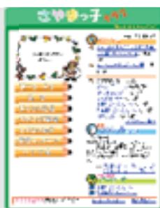
毎週更新! さやまっ子ニュース