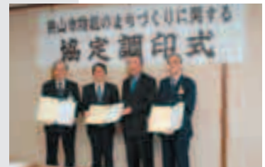
防犯で安全安心なまちづくりを