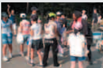
英語で過ごす3日間。サマーキャンプ