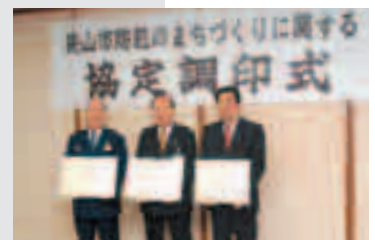
同協定は4件めの締結に