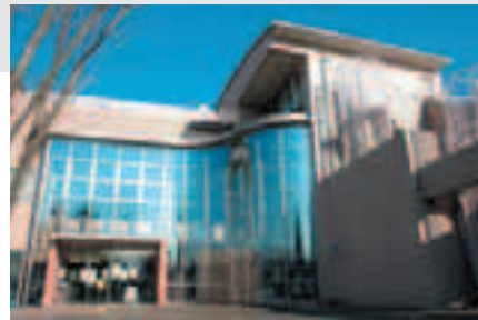
指定管理者による運営を開始。サビオ稲荷山

市4役の期末手当(6月から) 部長職・次長職の期末・勤勉手当(12月から)を減額