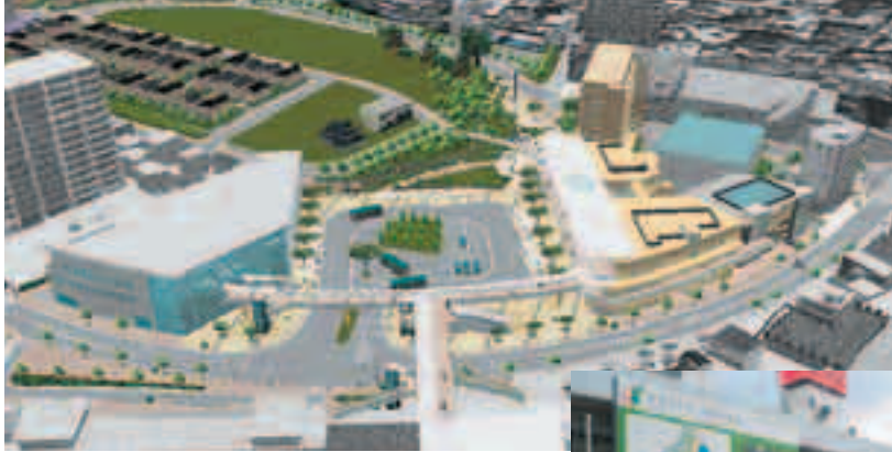
狭山市駅西口駅前の完成イメージ 駅前に掲げられた整備の概要