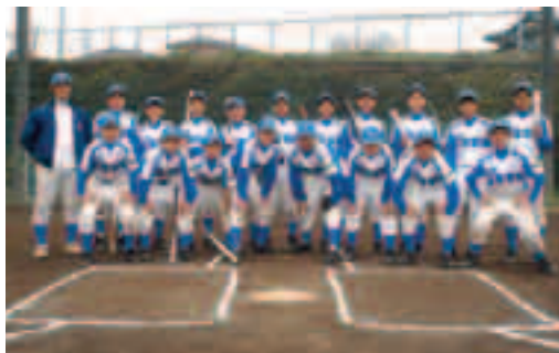
●中央中学校 野球部

私たち野球部は、18名の部員が礼儀やあいさつ、仲間を思いやることなどをモットーに、チームワーク良く活動しています。また、先生にいわれなくても自分たちで考え、行動できるように、部の「部則」と「活動方針」をみんなで話し合って決めました。6月に行われる大会では少しでも良い成績を残せるよう、日々練習に励んでいます。