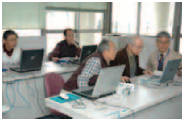
講座は4日間の2コース、16名が参加

3月24日、サンパーク奥富でIT講習会が行われ、デジタルカメラの使い方から写真の加工、整理の仕方などを教わりました。参加者は、「写真のメール交換が楽しみ。今後は、もっといろいろな写真を撮ってみたい」とデジタルカメラの楽しみ方を学びました。