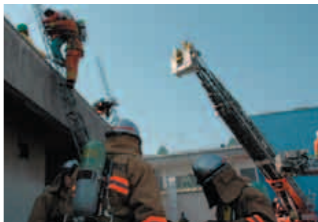
ビルの2階からの被災者救出訓練

2月22日、富士見地区の(株)コーセーで、消防演習訓練が実施され、避難誘導・応急救護訓練、県防災航空隊ヘリコプターによる空からの救出訓練などが行われました。