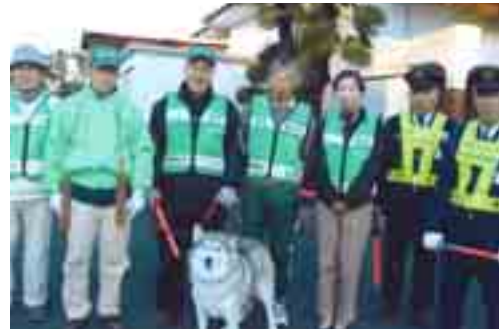
防犯パトロールは地域の安全を守る重要な事業

2月21日、市民総合体育館で初心者剣道教室（全5回）が開かれました。小学生を中心に、参加した24名は、先生から剣道で重要な礼儀作法や掛け声の大切さ、竹刀の持ち方など、剣道の基本を学びました。