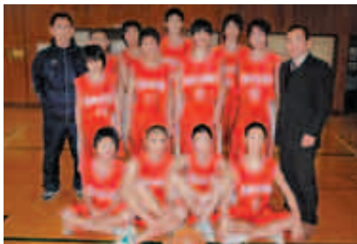
●入間川中学校 男子バスケットボール部

私たちの部は、12名の部員が明るく、楽しく、元気よくをモットーに、二人1組でのシュート練習や全面を使った3対2などの基礎練習に励んでいます。他校と比べて体格的に大変恵まれていることが自慢です。また、外部コーチの指導も受けることができ、やる気に満ちています。今年の最大の目標は、市内で優勝することです。