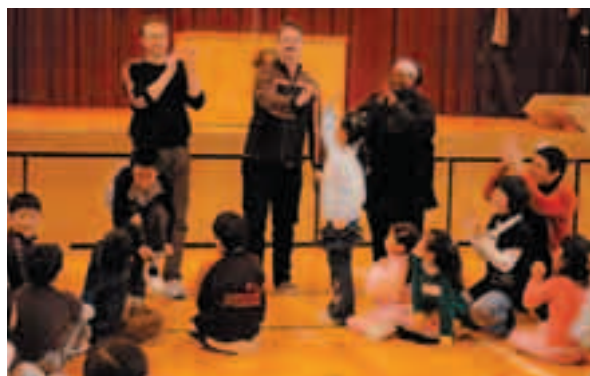
遊びをとおして 自然と英語を覚えます

2月2日、入間川小学校で小学生英語フェスティバルが開催され、小学生による英語の歌や英語劇、ゲストの中学生のスピーチがありました。ALTの外国人の先生から、ゲーム遊びなどで、参加した約130名の小学生は英語に楽しく触れることができました。