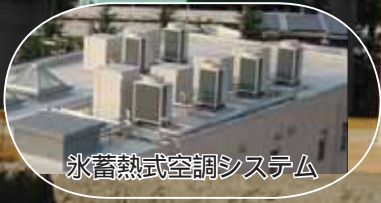
氷蓄熱式空調システム