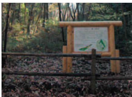
散策路や案内板が整備された緑のトラスト保全第9号地「堀兼・上赤坂の森」約6ヘクタール

1月 1日 「狭山市歩きたばこ等の防止に関する条例」が施行 4月16日 ISO14001ダイア4市の合同自己宣言 5月 1日 市内駅周辺を路上喫煙禁止地区に指定 10月 1日 「プラスチック」の分別収集が入間川地区でスタートし、全地区で完全実施 10月31日 第一環境センターリサイクルプラザが完成 11月 9日 緑のトラスト保全第9号地「堀兼・上赤坂の森」がオープン