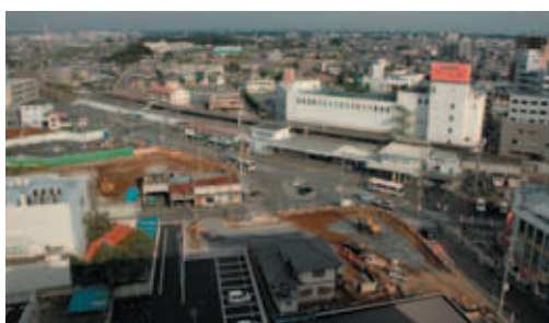
建物解体工事や道路整備が進み、新しい狭山の顔が徐々に見えてきた狭山市駅西口