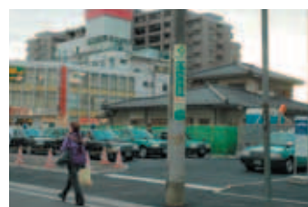
一時移設された狭山市駅西口のタクシー乗り場