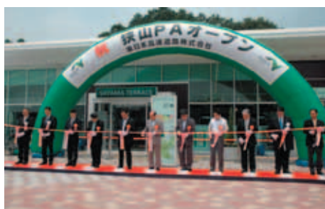
圏央道の狭山PA(外回り)では地元狭山の物産コーナーも設置