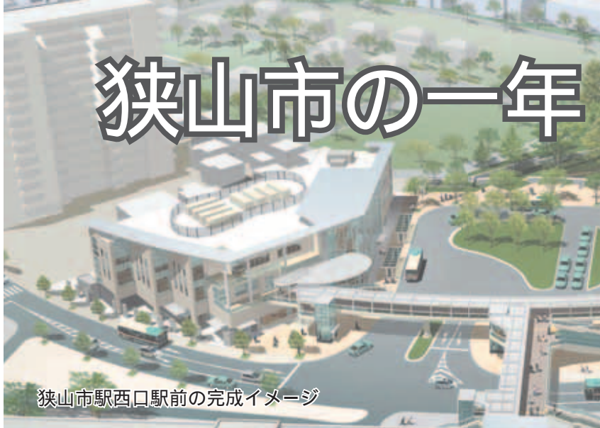
狭山市駅西口駅前の完成イメージ