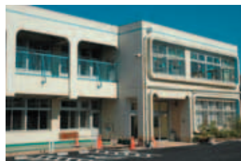
子育てプレイス奥富は、乳幼児を持つ親と子どもに交流する場を提供し、仲間作りの手助けをしながら、子育てに関する相談や情報などを提供しています