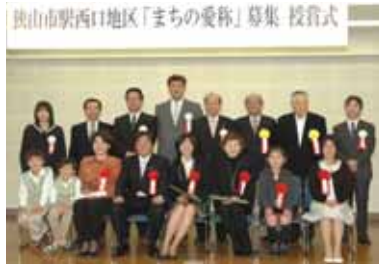
狭山市駅西口地区「まちの愛称」募集 授賞式

平成20年11月17日から12月16日まで、狭山市駅西口地区第一種市街地再開発事業地区の「まちの愛称」募集を行い、343作品の応募がありました。「語感の響きが良いこと」「覚えやすいこと」「表現しやすいこと」「親しみやすいこと」などの選考基準により選考を進め、最優秀作品1点と次点作品5点が決定しました。 最優秀賞スカイテラス(まちの愛称に採用) 優秀賞 Solsa CHAPIA SCAT CITY 西口再開発協議会賞都市みらい狭山・Duo チャレンジ賞OCHASSEさやま 問合せ狭山市駅西口開発事務所へ 2955 0023