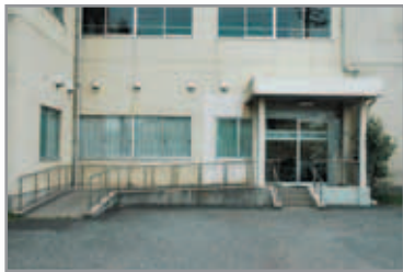
狭山台教室 狭山台1-21 狭山台北小学校内

友達から勧められて、奥富教室に通うようになりました。スタッフの方が親切に指導してくださり、痛かったひざもすっかりよくなりました。住まいから遠くても、送迎があるので本当に便利です。楽しく健康になれる