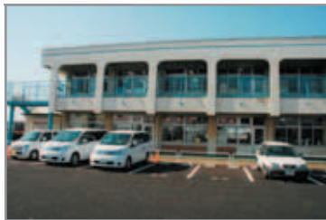
奥富教室 下奥富1100 旧奥富幼稚園内