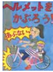
ポスターの部・最優秀作品

狭山市交通安全対策協議会で募集した交通安全作品の入賞作品が決まりましたので、各部門の最優秀賞に選ばれた作品をご紹介します。おめでとうございます。