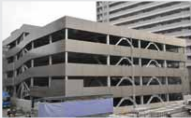
狭山市駅西口駐車場