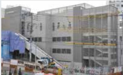
狭山市駅西口第1自転車駐車場