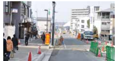
一方通行から相互通行となる霞野線