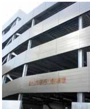
狭山市駅西口駐車場入口