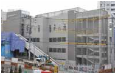
狭山市駅西口第1自転車駐車場