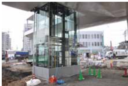
駅前広場デッキには、エレベーターとエスカレーターを設置