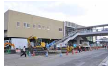
狭山市駅橋上駅舎