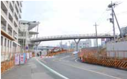
商業棟と新都市機能ゾーンをつなぐ市民広場デッキ