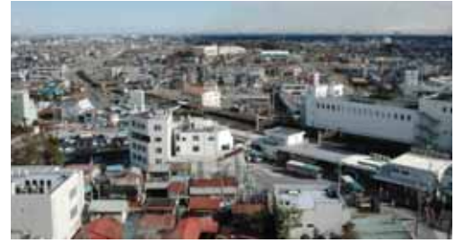
整備着工直後の狭山市駅西口地区のようす (平成20年1月撮影)