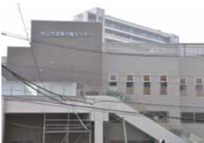
狭山市産業労働センター