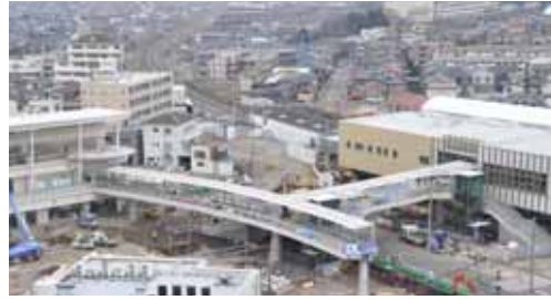
現在の狭山市駅西口地区のようす (平成22年2月撮影)