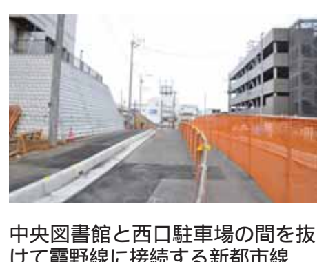
中央図書館と西口駐車場の間を抜けて霞野線に接続する新都市線