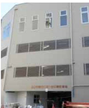
狭山市駅西口第1自転車駐車場入口