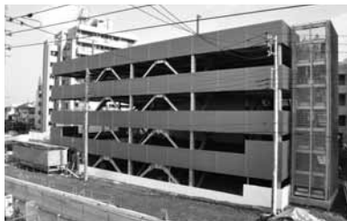
狭山市駅西口駐車場