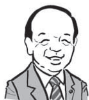
狭山市長 仲川幸成 似顔絵・池原昭治氏