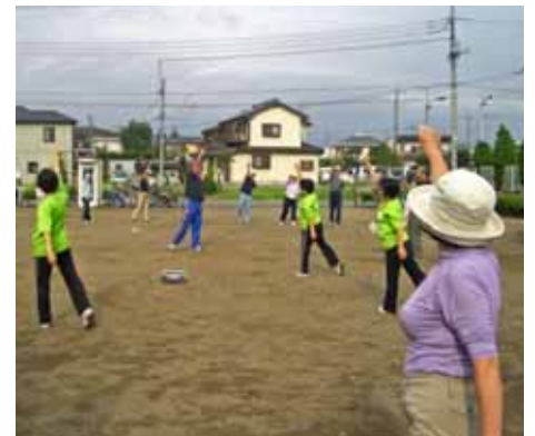
地域での健康づくり活動

地域福祉の推進に当たっては、市民の皆さんに理解を深めていただき、多くの方の参加を促すため、各地区センターで、計画の趣旨説明と