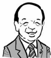
狭山市長 仲川幸成 似顔絵・池原昭治氏