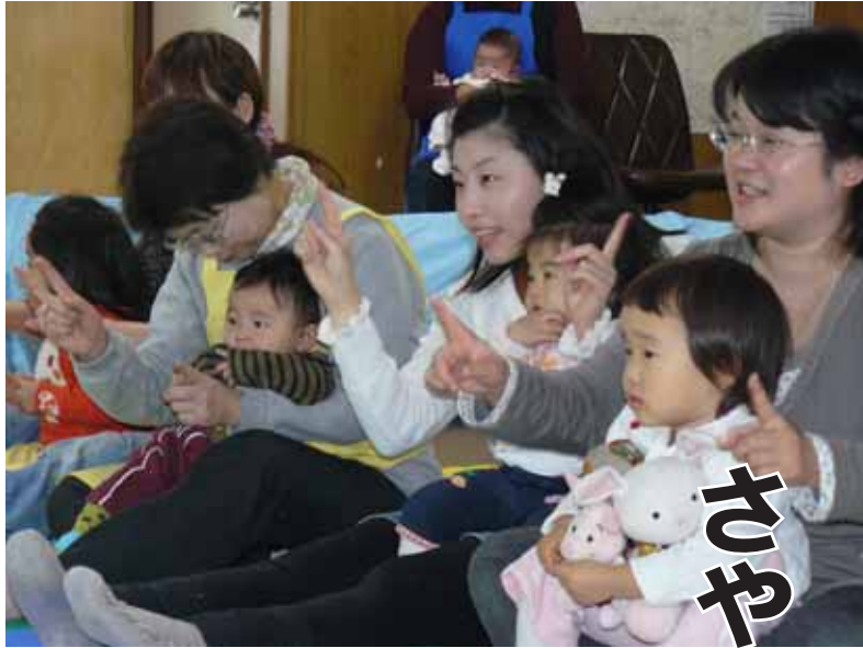
地域で子育て支援「親子サロン」

吾野駅(当時の終点)で下車、国道299号線を高麗川に沿って歩き、現在の正丸トンネルの手前あたりから登り始めた記憶