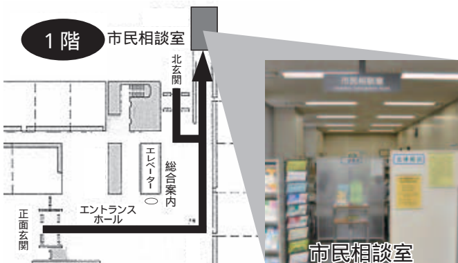
市民相談室案内図(本庁舎1階)

法律相談は、予約時間に遅れると相談できませんので、予約時間の15分前までにお越しください。なお、予約を取り消すときは早めにご連絡ください