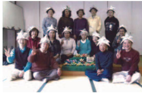
高齢化が進む中、地域の和を作り上げるためにも皆さんの力が必要です