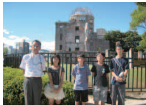
広島平和記念公園内 原爆ドーム前にて

8月6日、広島市で開催された「広島市原爆死没者慰霊式並びに平和祈念式」に市内中学校の生徒4名が参列しました。子ども達は式典への参列のほか、慰霊碑への献花や同級生が制作した千羽鶴の献納、原爆ドームや広島平和記念資料館の見学をとおして、改めて戦争の悲惨さと平和の大切さについて認識を深めました。