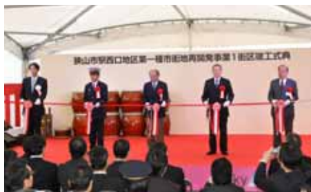
狭山市駅西口地区第一種市街地再開発事業1街区竣工式典でのテープカット。安全・安心な駅前づくりの第一歩