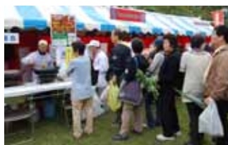
栄養とヘルシーさを兼ね備えた狭山の新名物として、さといもコロッケへの期待は大きい(10月24日に開催された商工祭での発表会)