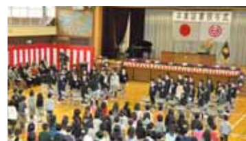
狭山台北小学校最後の卒業式。統廃合により、4月から狭山台小学校が開校