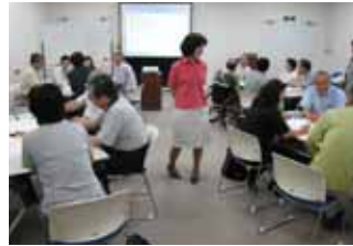
(仮称)狭山元気大学の3つの試行コースに57名の皆さんが参加。意欲的に学習に取り組む