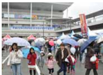
式典終了後、まち開き記念事業「スカイフェスタ」が開催され、多くの市民の皆さんが新しいまちスカイテラスの誕生を祝う