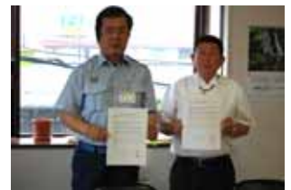
災害時の電力と電気設備などの復旧に関する協定(左)と消防活動時の重機の投入に関する覚書(右)を締結し、官民が一体となって防災対策を推進