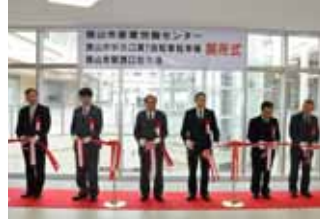
産業労働センターの開所式でのテープカット。狭山市の産業情報の拠点になる