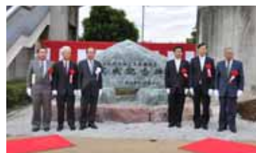
上広瀬土地区画整理事業の完成を祝し、虹の遊歩橋用地に記念碑を建立