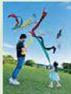
初めての鯉のぼりと、2度目の鯉のぼり エマロア(広瀬東)