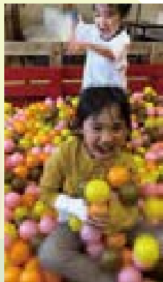
サンパーク奥富 キッズパーク楽しいな。 ひよそら(南入曽)