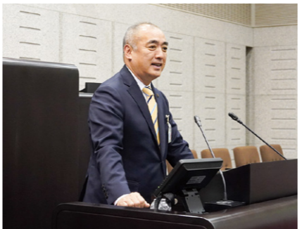
第1回市議会定例会で施政方針を述べる小谷野市長

令和8年第1回市議会定例会(会期2月20日～3月17日)で、小谷野市長が8年度の施政方針として、市政運営の基本的な考えや重点施策などを述べました。今月は、その概要をお知らせします。