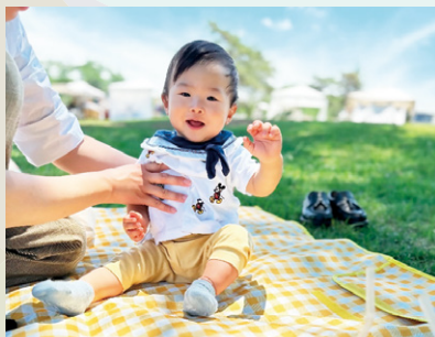
稲荷山公園でピクニック♪ ごまだら(北入曽)