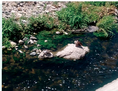
不老川主の亀と鴨が仲良く日向ぼっこ ヤマグニ(狭山台)