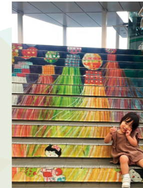
ママここで撮って！とポーズ決めて待機 kae(入間川)