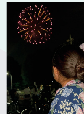
入間基地納涼祭 つな(笹井)