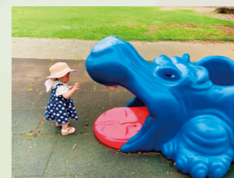
カバさんとらめっこ！ ゆりんこ(狭山台)