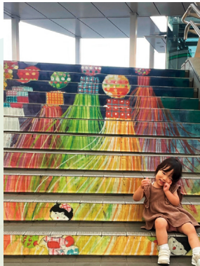
ママここで撮って！とポーズ決めて待機