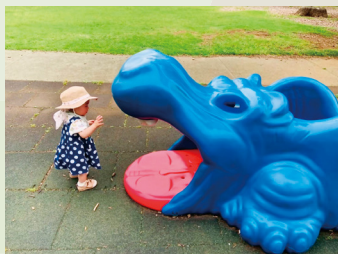
カバさんとらめっこ！